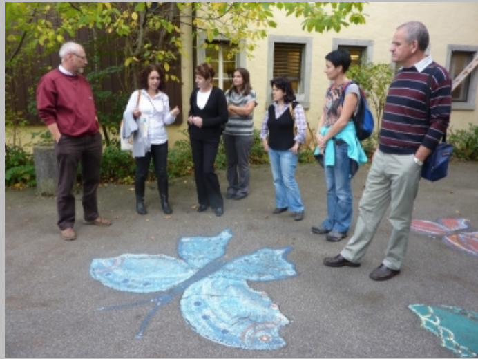
Zentrum Sonne, Elsau