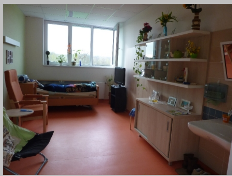
Před otevřením nového Domova