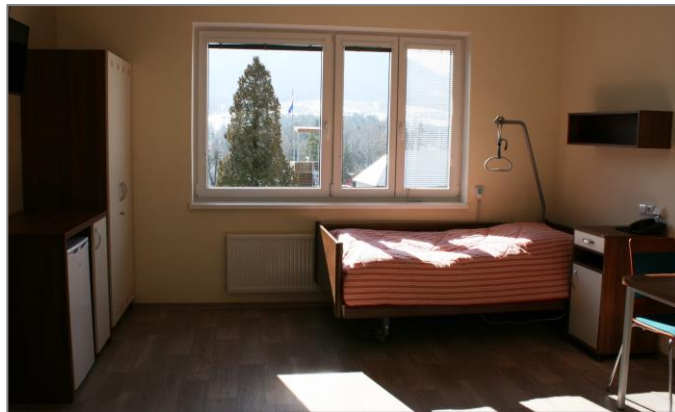
Jeden z pokojů s polohovacím lůžkem s antidekubitní matrací