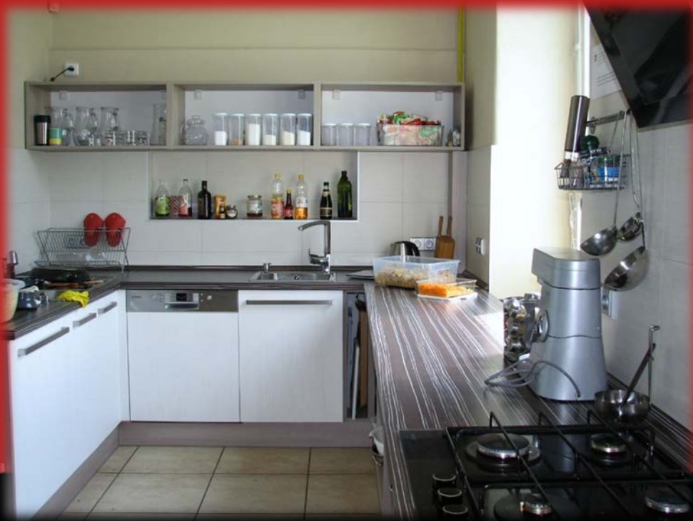
naše nová kuchyň Amette