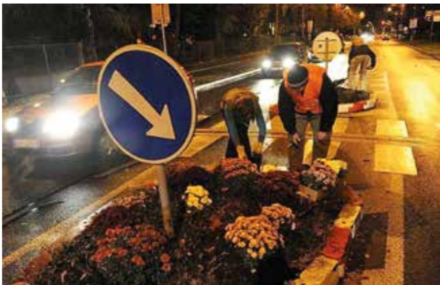
Fotografie z výsadby štěrkového ostrůvku

místních obyvatel, kteří byli osloveni, aby se aktivně zapojili do projektu, a to jak formou návrhů a nápadů, tak praktickým vysazováním rostlin. Příklady realizovaných výsadeb, které oživily porubské ulice v podzimním období, uvádíme v příloze.