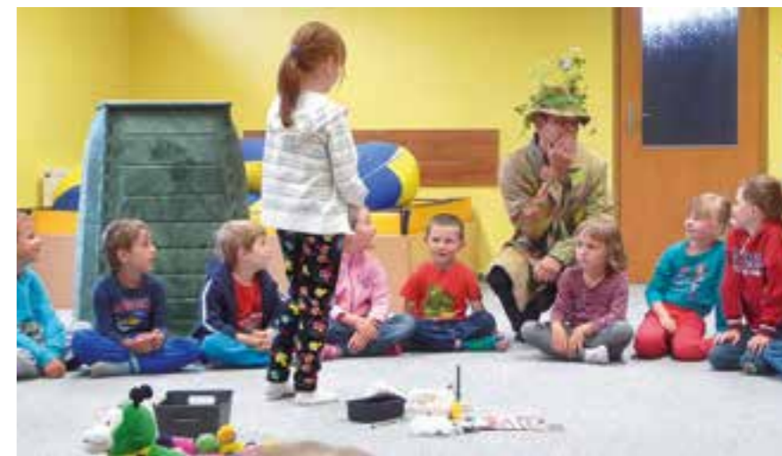
Skřítek Kompostníček mezi dětmi MŠ

Především rodičům, prarodičům a dětem byla určena exkurze do kompostárny v Písku, kde se návštěvníkům věnoval vedoucí odboru životního prostředí Ing.