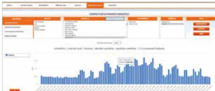
Výstup ze software pro dálkové odečty

nickém stavu. Pasport se skládá z jedenácti hlavních částí (I. Identifikace budovy; II. Hodnocení objektu; III. Stavebně-technický stav; IV. Vytápění; V. Příprava teplé vody; VI. Chlazení; VII. Větrání; VIII. Osvětlení; IX. Sanita; X. Opatření; XI. Přílohy). Rozsah pasportizace a její „online“ verze je tak inovativní v podmínkách českých měst a obcí.