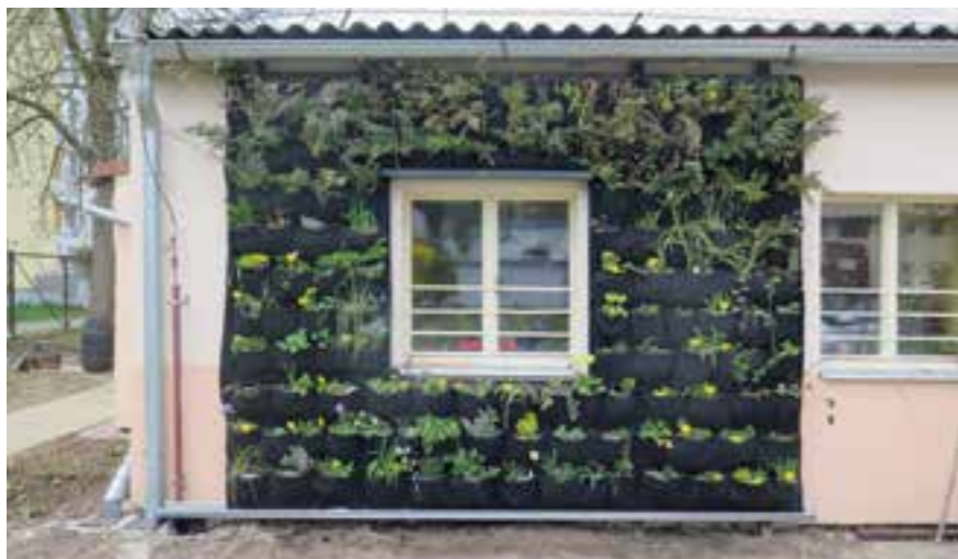
Výuková vertikální zahrada, Praha-Komořany

Na osázení vertikální zahrady se podílela veřejnost při workshopu, jehož účastníci si mohli vyzkoušet, jak se rostliny do vertikální zahrady sází.