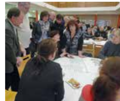
Z prachatického Fóra zdravého města

Cílem diskuze, která probíhala u devíti stolů rozdělených dle témat, bylo definování tzv. desatera hlavních problémů, podnětů či příležitostí města. Témata u jednotlivých stolů byla: (i) Životní prostředí, plán odpadového hospodářství, (ii) Rozvoj města, zaměstnanost, podnikání, investice, (iii) Sociální oblast, bezpečnost a prevence, (iv) Doprava, parkování, stav komunikací, (v) Školství, výchova, vzdělávání, (vi) Kultura, sport, volný čas, cestovní ruch, (vii) Zdraví obyvatel, zdravý životní styl (viii) Názory mladých a (ix) Občan a úřad, informovanost.