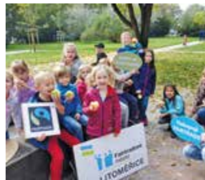
Litoměřice – Fairtradové město

při Sportovním jarmarku, kde se prezentují místní mládežnické sportovní oddíly. V rámci Dnů bez tabáku jsou pořádány pravidelné přednášky pro žáky základních a středních škol zaměřené na prevenci kouření. Ke zvýšení zájmu o dané téma jsou certifikovány nekuřácké provozovny a byla vyhlášena též soutěž o nejlepší protikuřácký videoklip.