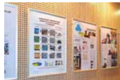
Informační tabule POH

projednáván v expertní skupině, s veřejností a následně projednán v zastupitelstvu města.