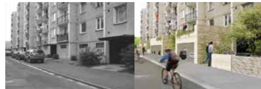
Sídliště Spořilov Jilemnice „Potenciál rozhraní domů a ulice“

Navržená řešení urbanistických změn byla na setkání obyvatel sídliště Spořilov se zpracovateli studie vesměs přijímána kladně, připomínky k řešení měly jen věcný charakter. Z těchto setkání s místními občany jsou k dispozici prezenční listiny, pozvánky a fotodokumentace.