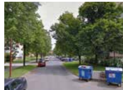
Zeleň na sídlišti Štěpnice

Dále byla stanovena perspektiva stromu na jeho stanovišti, stabilita stromu (odhad možného ohrožení provozní bezpečnosti na základě pozorovatelných defektů větvení, infikace kmene, výskytu dutin či