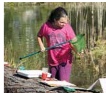
Terénní výuka žáků ZŠ

▪ Osvětově-inspirační skládačka a audiostezka městem – mokřady byly ve spolupráci s místním „audiotýmem“ napojeny na audiostezku vedoucí městem a jeho okolím. Dále byla vydána kombinovaná osvětově-inspirační skládačka, jejími důležitými částmi bylo vyvrácení předsudků o mokřadech a také přehled obecných zásad při zakládání mokřadů.