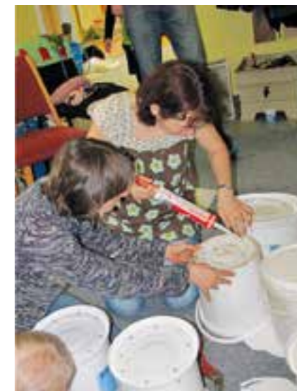
Výroba vlastního vermikompostéru

Poslední setkání bylo nazváno Žížaly v akci! Vyrobit si vlastní vermikompostér přišlo 36 zájemců včetně dětí. Z plastových kyblíků vyrobili 10 kompostérů, které si rodiny odnášely domů s „násadou“ žížal, trochou kompostu a s množstvím informací a praktických rad, jak se o žížalí kompostér správně starat. Jeden vermi-