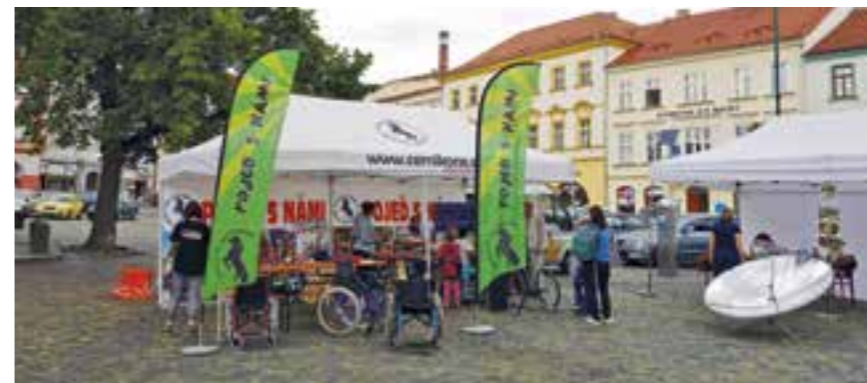
Účast neziskového sektoru