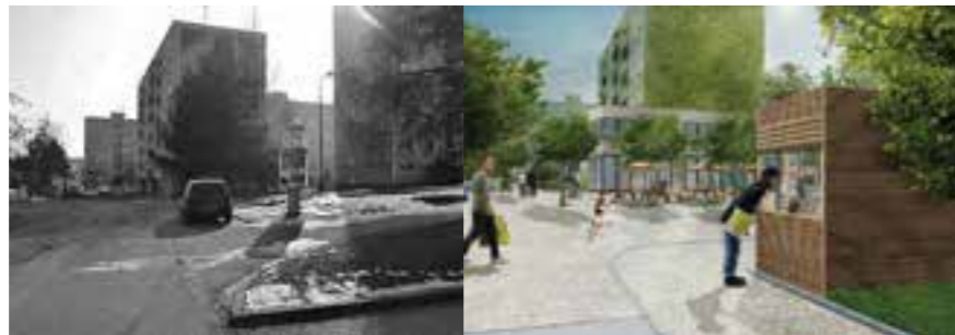
Sídliště SPOŘILOV Jilemnice „Centrum“

na otázky spokojenosti obyvatel ve městě, které bylo rozšířeno o šetření otázek spojených s urbanismem, bydlením a udržitelnou dopravou. Součástí byly i specifické otázky obyvatelům sídliště (podklady pro urbanistickou studii). Indikátory sleduje město Jilemnice již od roku 2010, takže trendy z těchto šetření šlo vysledovat.