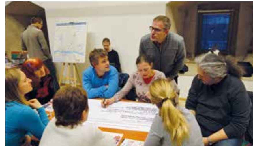
Diskuze u Kulatého stolu

Příkladem kulatého stolu je např. diskuzní fórum s názvem Co děti, mají si v Litoměřicích kde hrát . Za účasti zástupců