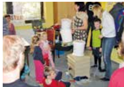
Informační akce pro děti z mateřských škol

Téměř stovka účastníků Fóra Zdravého města diskutovala 18. února 2016 v sále