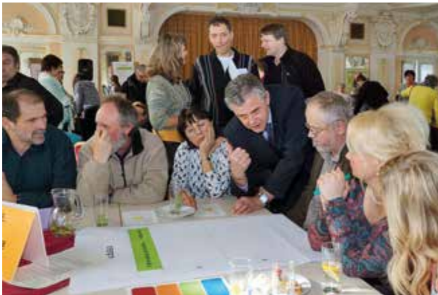
Z veřejného projednávání „Desatera problémů“, jedním z témat je odpadové hospodářství

Existuje množství způsobů, jak napomoci snížení produkce odpadů a může se do nich zapojit každý obyvatel města. Veřejnost byla proto seznámena s praktickými kroky, kterými mohou přispět ke snížení množství vyprodukovaných odpadů (např. do obchodů si brát vždy vlastní tašky, pokud je to možné, dát přednost nápojům obsažených ve vratných lahvích, nakupovat nebalené, případně jednoduše balené zboží, upřednostňovat zboží z recyklovatelných materiálů, důsledně tříditi jednotlivé složky komunálního odpadu nebo kompostovat biologicky rozložitelné odpady apod.). K tématu dne byly přizpůsobeny i doplňkové aktivity a tvořivé dílny pro všechny generace.