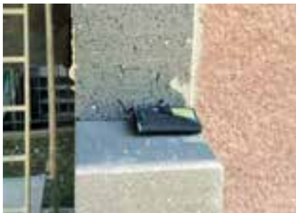
Pasportizační prvek monitoringu

Další aktivitou bylo zpracování pasportu majetku pro objekty města Litoměřice. Daný pasport tak napomáhá k třídění majetku do kategorií nejen dle spotřeby energie, ale i dle technického stavu a umožňuje lepší plánování renovace a údržby majetku města, kdy cílem je, aby byly veškeré významné projektové dokumentace objektů majetku města k dispozici „online“ včetně aktuálních informací o energetické třídě budovy a jejím tech-