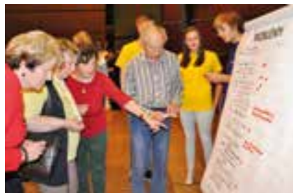
Hlasování v průběhu fóra

ověřují sociologickým průzkumem, aby byly výsledky co nejdůvěryhodnější.