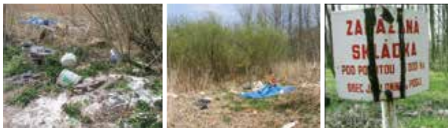
Sanace parku v Jablonném v Podještědí

zapojení veřejnosti do řádné péče o mokřady formou dobrovolnických akcí, součástí byla také publicita projektu a vhodné propagační předměty.