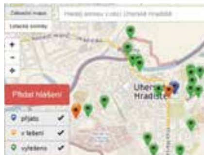
Zobrazení hlášení v aplikaci „Zlepší své město“

Každé město/obec má své komunikační kanály, ale přesto je těžké oslovit a motivovat potenciální účastníky, aby se do rozhodovacího procesu zapojili. Proto se tento projekt mimo jiné zaměřil