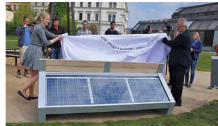
Solární lavička CapaSitty

i na celosvětové výstavě EXPO 2015 v Miláně. Jde o první „chytrou“ lavičku určenou nejen k odpočinku ve veřejném prostoru v ČR. Nabízí možnost bezplatného připojení k internetu a dobíjení mobilních telefonů, tabletů, čteček i fotoaparátů, a to pouze s využitím solární energie.