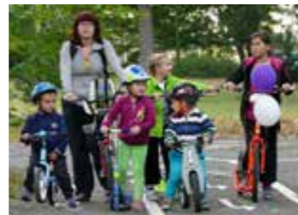
Stanoviště Besip na akci „Na kolo jen s přilbou“.

prostřednictvím zážitkových forem dozvěděly více o lidech se zrakovým postižením. U stánku BESIPU se zapojili i rodiče. Měli za úkol vyplnit dopravní testy pro cyklisty, mohli si vyzkoušet slalom v „alkoholových“, „únavových“ či „drogových“ brýlích. Po splnění všech stanovišť následovalo losování o ceny. Na pět vylosovaných čekaly hodnotné ceny v podobě poukazů na nákup cyklistických potřeb. Všichni malí cyklisté obdrželi reflexní samolepky či reflexní přívěsky. Rodiče, kteří na akci přijeli na kole, byli odměněni cyklistickou lékárníčkou.