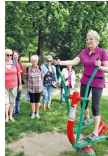
Místa v Litoměřicích přátelská seniorům

klubů seniorů, turistika apod.) Senioři, kteří se zúčastní 8 z 16 nabízených akcí, jsou odměněni na společném setkání seniorů se starostou města.