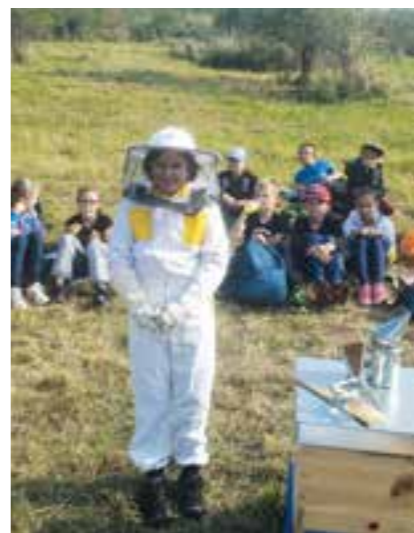
Výukové aktivity v Parku Rochus

Druhý z programů, Vše o včelách , využívá praktikovaného chovu včel na Rochusu a seznamuje žáky s hlavním pří-