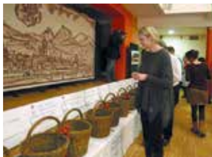
„Hlasovací zařízení“ na kávová zrnka

V oblasti Životní prostředí se u stolu diskutovalo o POH, třídění odpadů a motivaci. Právě motivační systém se u stolu dostal do popředí zájmu a účastníci o něm hlasovali. Podnět Zavedení motivačního systému separace odpadů pro občany s vlivem na snížení poplatku, získal 256 hlasů a čtvrté místo v celkovém pořadí.