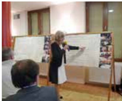
Ze semináře Fórum zdravého města

stují, umí to. Nicméně setkání mělo přispět k další osvětě, informacím o správném a optimálním kompostování, o kompostérech. Přítomní občané získali základní pravidla kompostování, přednášející se dotkl chyb, ale i využívání kompostu, nechyběla informace o žižalách.