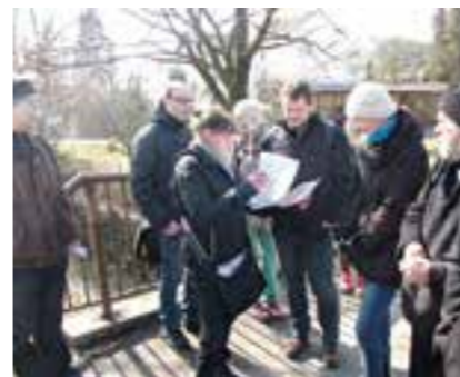
Exkurze při osvětové kampani