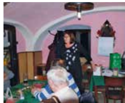
Cyklus praktických workshopů

o třídění odpadů, jak správně kompostovat, jak předcházet vzniku odpadu.