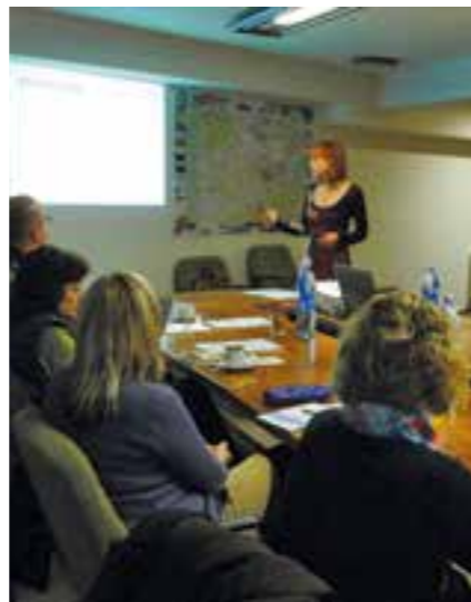
Z přednášky Šetrná spotřeba

Přednášky proběhly na jedné základní a jedné střední škole na území městského obvodu Poruba a jejich cílem bylo přiblížit posluchačům závažnost současného stavu životního prostředí, informovat o alternativních zdrojích energie a možnostech takových využitelných