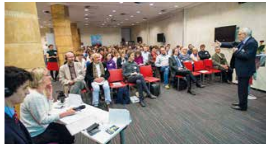
Z přednáškového sálu na konferenci „Počítáme s vodou“

Ze zahraniční exkurze za příklady dobré praxe