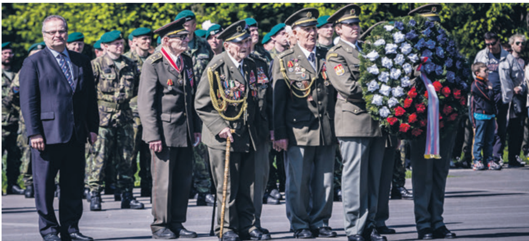
Památce spolubojovníků se 30. dubna v Komenského sadech poklonili čestní občané města plukovník Bedřich Opočenský (za vojákem s věncem) a plukovník Karel Šerák (uprostřed s hůlkou). Poslední dva žijící velitelé československých tanků, které v roce 1945 osvobodily Ostravu.