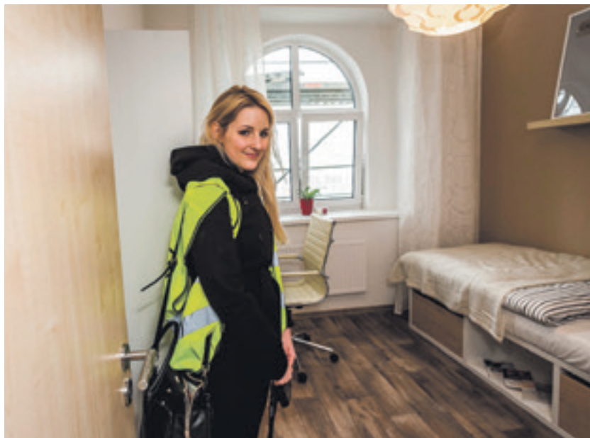
Vzhled a vybavení studentských pokojů působí stylově a sympaticky

Cena za místo v kampusu bude stanovována podle typu a komfortu