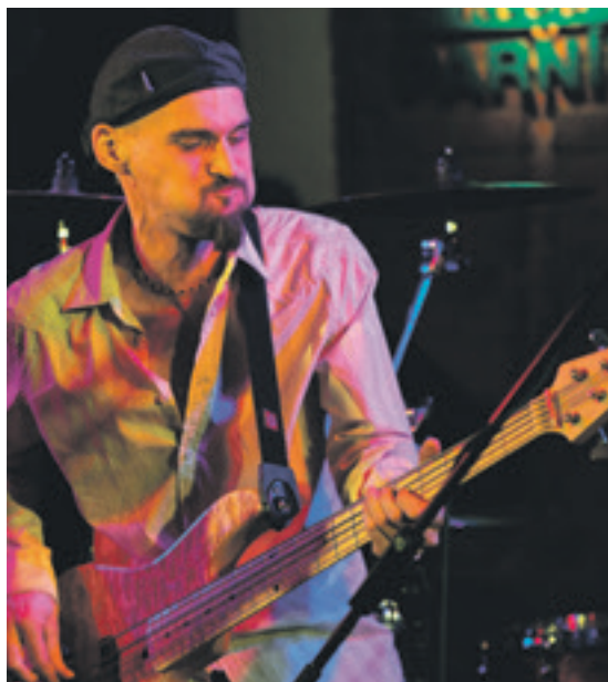
Z koncertu v klubu Parník