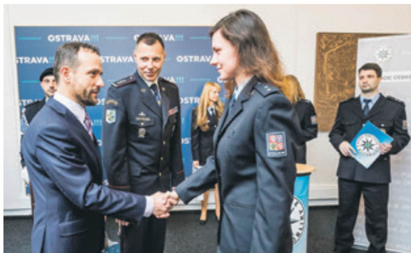
Mezi nováčky v policejní uniformě, kteří si potřásli rukou s primátorem, byly i čtyři ženy

pětiměsíční praxe na jednotlivých útvech. Plnoprávními policisty se stanou po roce. Pokud půjde vše podle předpokladů, devět nových policistů zůstane sloužit v Ostravě. (bk)