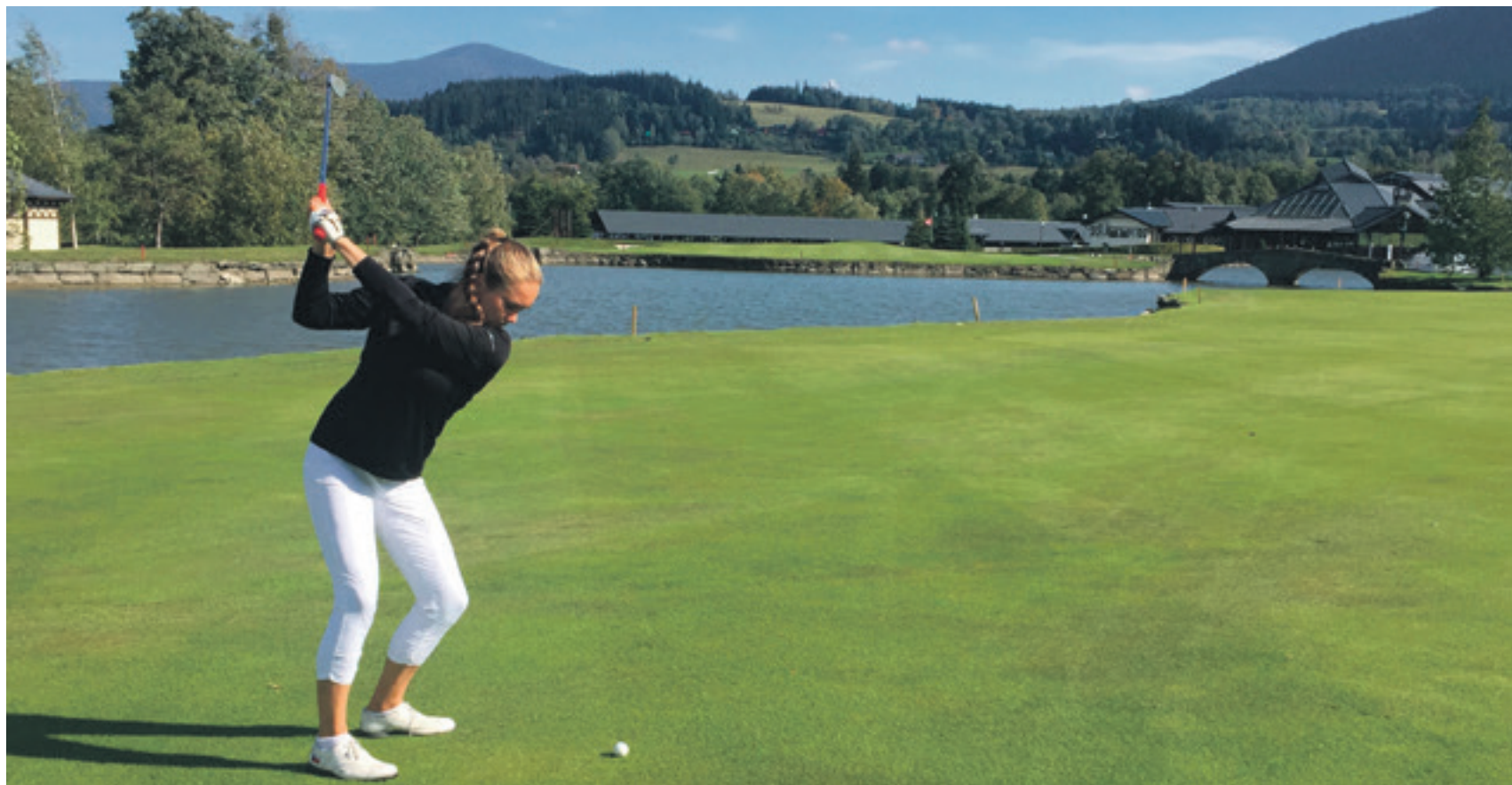
Na odpališti se talentovaná golfistka cítí jako doma. Nejraději trénuje a hraje v Prosper Golf Resortu v Čeladné.