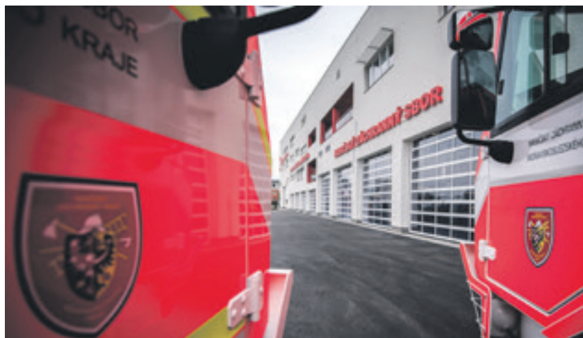
IVC Ostrava-Jih je svým rozsahem a komplexností unikátní nejen u nás, ale i ve střední Evropě

Výstavbu Integrovaného výjezdového centra v Ostravě-Jihu za téměř 250 milionů korun realizoval kraj. Většina nákladů byla pokryta z evropských dotací, 15 procenty se na financování stavby podílel kraj. Stranou nezůstalo město Ostrava. „Z rozpočtu jsme na výstavbu poskytli 11 milionů korun na průzkumné a projekční práce, dalších 7 milionů jsme investovali do rozšíření příjezdové komunikace včetně výstavby chodníků a osvětlení. Stavělo se také na městských pozemcích, které jsme darovali nebo vypůjčili. V dalších letech budeme hradit 59 procent z nákladů na provoz,“ upřesnil 25. dubna při zahájení provozu IVC primátor Tomáš Macura. (bk)