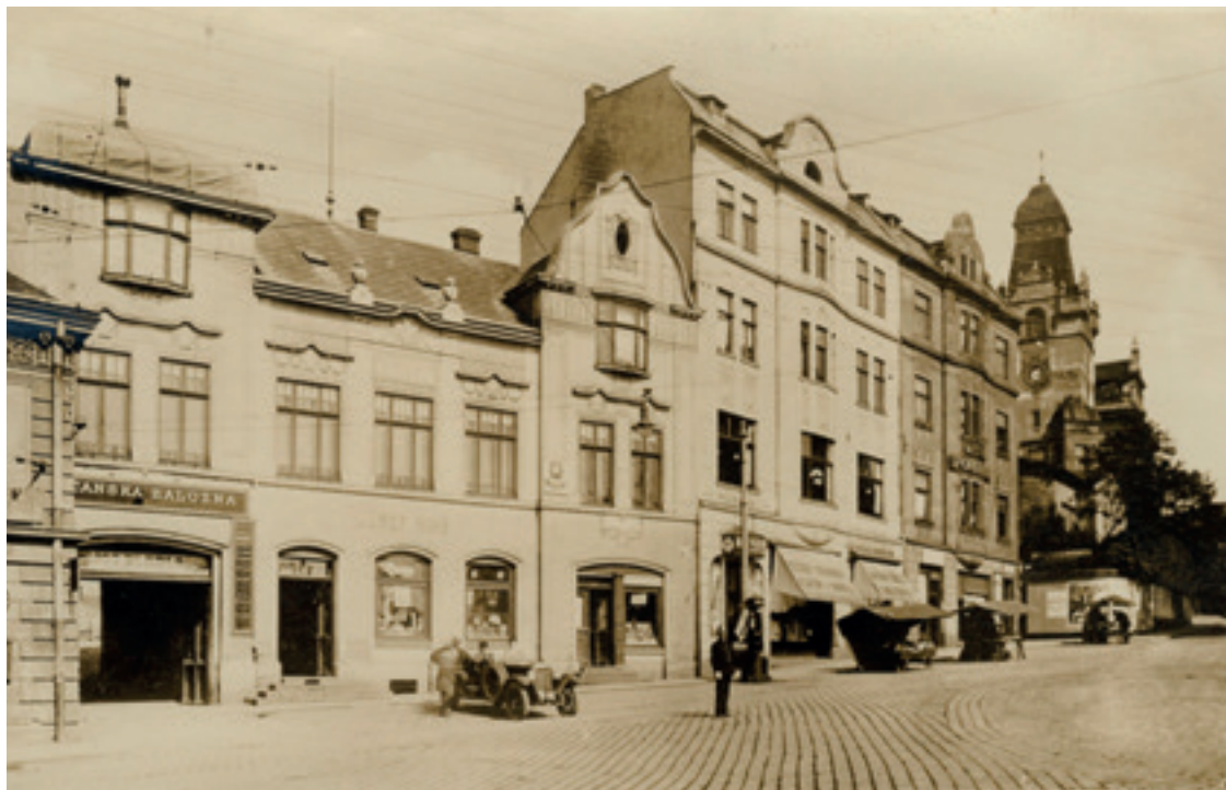
Dům č.p. 312 stál na Záměstí, proti dnešnímu mostu Miloše Sýkory (nyní je v těchto místech památník 1. čs. tankové brigády). Notářská kancelář JUDr. Pelce se nacházela v prvním patře.