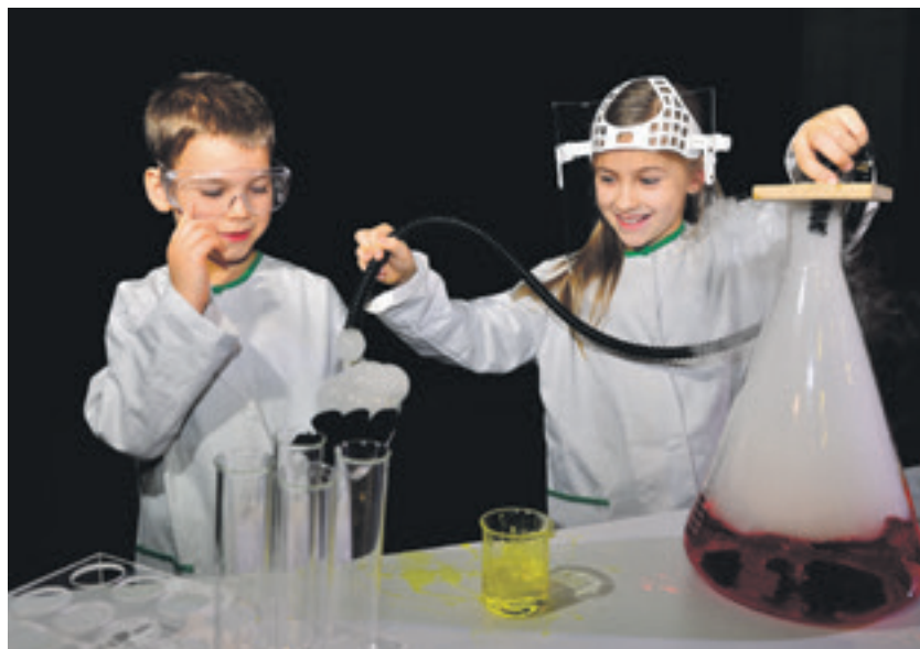
Město podporuje možnost interaktivního vzdělávání ve vítkovickém Světě techniky

na celkovou částku 68,7 mil. korun. Nejzazší termín pro odevzdání žádostí v rámci druhého kola byl stanoven na 6. května. (bk)